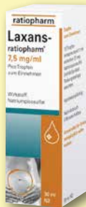
Laxans- ratiopharm® 7,5 mg/ml Pico Tropfen 30 ml

Achten Sie auf weitere Angebote in unseren Apotheken!