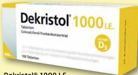
Dekristol® 1000 I.E. Tabletten 100 Stück

Haben Sie schon vom elektronischen Rezept gehört? Kurz E-Rezept. Damit werden Sie ärztliche Verordnungen per Smartphone einlösen können. Oder Sie bleiben beim Papierrezept. So oder so: Bei Ihrer Guten Tag Apotheke sind Sie immer richtig. Alles, was Sie zum E-Rezept wissen müssen, erfahren Sie dort und in der aktuellen Ausgabe unseres Gesundheitsratgebers MEIN TAG . Da entdecken Sie auch, wie Sie sich vor Maus-Arm und Co. schützen.