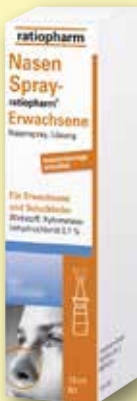
NasenSpray- ratiopharm® Erwachsene konservierungs- mittelfrei 10 ml

€ 8,95 Freundschaftspreis 100 ml = € 29,83