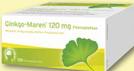
Ginkgo-Maren® 120 mg 120 Filmtabletten

€ 6,75 Freundschaftspreis 100 ml = € 5,63