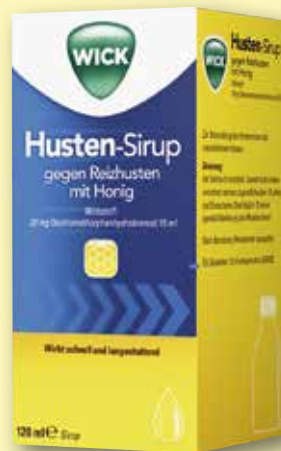
Wick Husten-Sirup gegen Reizhusten mit Honig 120 ml

€ 2,50 Freundschaftspreis 100 ml = € 25,00