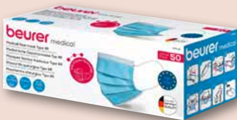
Beurer MM15 Mundschutz 3-lagig 50 Stück

*für bestimmte Pflegehilfsmittel zum Verbrauch gibt es gemäß SGB XI einen Erstattungsanspruch bis zu einer Summe von 40,- € pro Monat.