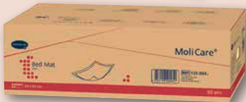
MoliCare Bed Mat Eco 7 Tropfen 60 x 90 cm, 50 Stück 32 Stück