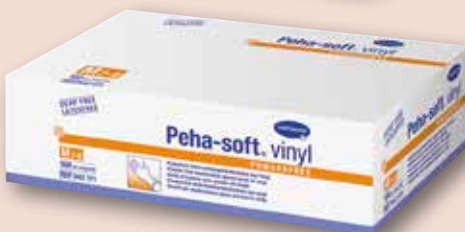
Peha-Soft® Vinyl Untersuchungs- handschuhe unsteril puderfrei versch. Größen 100 Stück